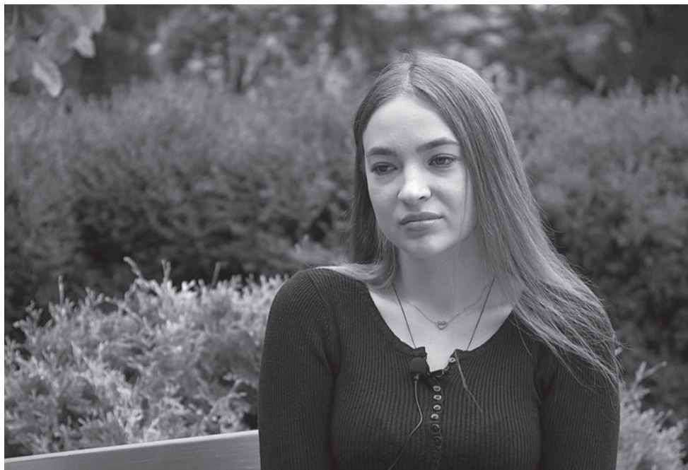
Владислава з Кременчука втратила коханого на війні: боялася сказати батькам, що їхній син загинув.

їхати в Дніпро до друга-строковика, який також служив із ним. Але наступного дня йому зателефонували з військової частини, з Кременчука. Сказали: мобілізуйся, розпорядження прийшло. Спочатку він служив на блокпостах у Кременчуці, наші підприємства охороняв. Потім його перевели у Дніпро, і звідти відправляли у гарячі точки.