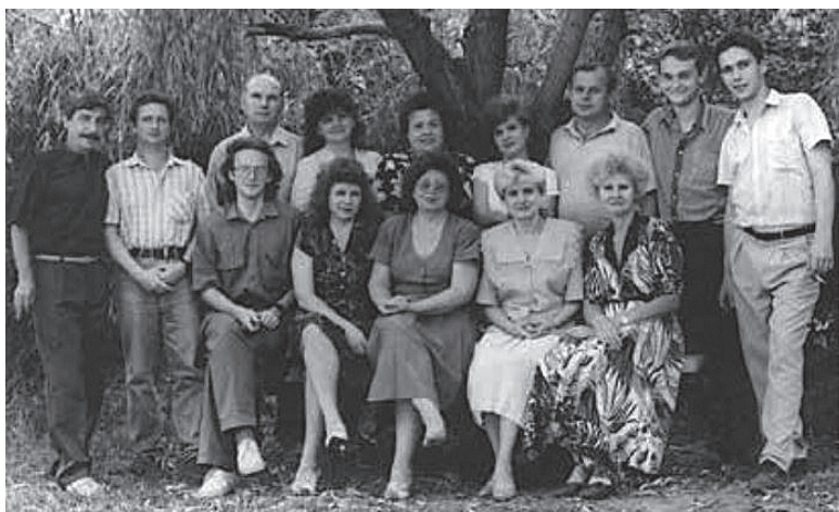
З колегами - творчим колективом «Вісника Кременчука»

Асоціація Незалежні Регіональні Видавці України