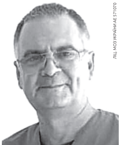
ЛІЦ. МОЗ УКРАЇНИ АЕ 571070

грунтовано застосований лікарем вчасно. Вибір метода лікування або застосування комплексної дії кількох методів залежить від отриманої лікарем інформації під час первинної консультації. Всі методи, які я застосовую в лікуванні хвороб хребта та суглобів, це інтенсивні, переважно ін'єкційні процедури селективної дії. Мета мого лікування - відновлення структур хребта та суглобів, що дасть вам можливість безболісно рухатись по життю далі. Запобігти необхідності хірургічного втручання, продовжити молодість опорно-рухового апарату, наскільки це можливо для вашого стану зараз. Дуже багато хвороб, які пов'язані зі станом шийного чи поперекового відділів хребта. Дуже різноманітні скарги пацієнтів. Не «заблукати» в цьому лісі та знайти вірне рішення мені допомагає досвід. Від багатьох хвороб у себе або у родичів можна позбавитись. Лікування в моєму центрі не потребує постійного перебування. Призначені планові процедури лікування проводяться у кабінеті раз на два тижні, протягом яких іде процес відновлення там, де