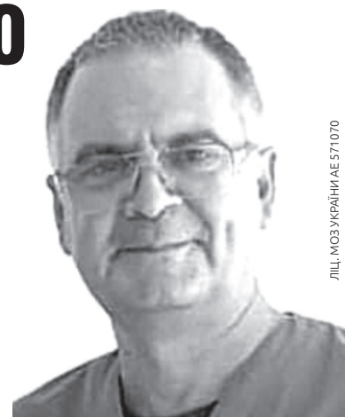
ЛІЦЬ. МОЗ УКРАЇНИ АЕ 571070

Так, МРТ дослідження найдорожче. Але тільки воно дасть лікарю можливість мати повну картину патологічних змін у хворому відділі хребта чи сугло-