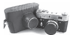
Фото з підписом, описом зображеного та роком зйомки, надсилайте на адресу gazetakremenchuk@gmail.com , або в Телеграм за номером +38098-124-84-90 . Також фото можна надсилати до редакції за адресою: м. Кременчук, вул. Шевченка, 50А . Усі фото повертаємо власникам.

Ми пропонуємо вам поділитися спогадами з земляками та надіслати фото зі своїх сімейних архівів. Ми їх обов'язково опублікуємо.