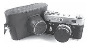
Фото з підписом, описом зображеного та роком зйомки, надсилайте на адресу gazetakremenchuk@gmail.com , або в Телеграм за номером +38098-124-84-90 . Також фото можна надсилати до редакції за адресою: м. Кременчук, вул. Шевченка, 50А . Усі фото повертаємо власникам.

Ми пропонуємо вам поділитися спогадами з земляками та надіслати фото зі своїх сімейних архівів. Ми їх обов'язково опублікуємо.