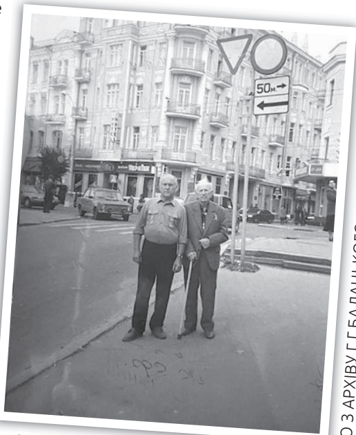
Кременчужани на вулицях Вінниці