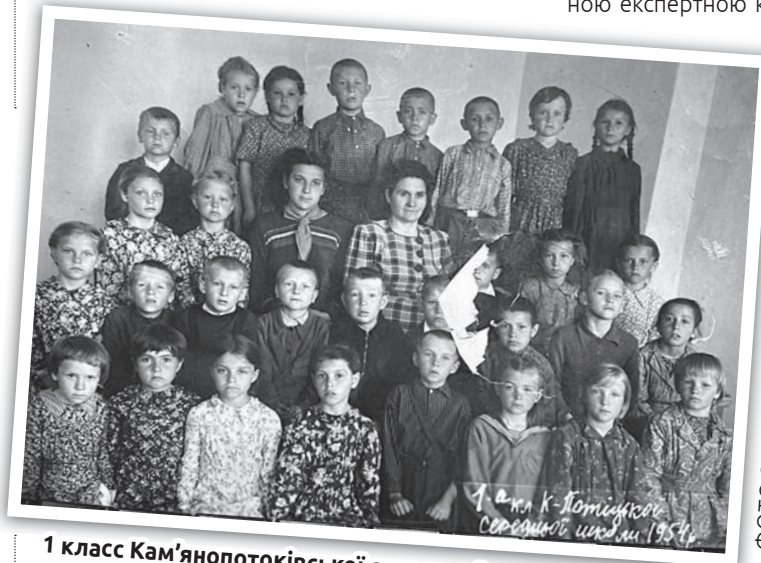
1 клас Кам'янопотоківської середньої школи, 1954 рік

– Згідно з частиною третьою статті 119 КЗпП за працівниками, призваними на строкову військову службу, військову службу за призовом осіб офіцерського складу, військову службу за призовом під час мобілізації, на особливий період, військову службу за призовом осіб із числа резервістів в особливий період або прийнятими на військову службу за контрактом, у тому числі шляхом укладення нового контракту на проходження військової служби, під час дії особливого періоду на строк до його закінчення або до дня фактичного звільнення, зберігаються місце роботи і посада. Стаття 119 КЗпП не містить норми щодо збереження в період військової служби щорічної основної відпустки, визначеної законодавством про працю.