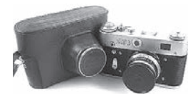
Фото з підписом, описом зображеного та роком зйомки надсилайте на адресу gazetakremenchuk@gmail.com , або в Телеграм за номером +38098-124-84-90. Також фото можна надсилати до редакції за адресою: м. Кременчук, вул. Шевченка, 50А. Усі фото повертаємо власникам.

Ми пропонуємо вам поділитися спогадами з земляками та надіслати фото зі своїх сімейних архівів. Ми їх обов'язково опублікуємо.