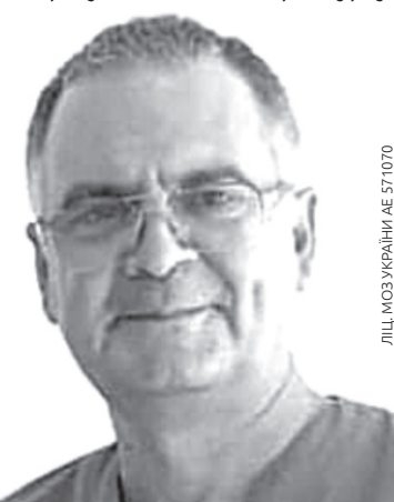
ЛІЦ. МОЗ УКРАЇНИ АЕ 571070

Інколи дивись на знімок МРТ... Людина має вже сісти у візок, а вона ще активно рухається. Але турбує біль, обмеження рухів. І ось тут у нагоді стає досвід лікаря. Аналізуючи по краплях ситуацію, ставлячи необхідні запитання, з'ясовуючи історію перебігу хвороби, проводячи огляд спини та суглобів руками, порівнюючи за десятки років практики — народжується правильне рішення. Якщо інформації не зо-всім достатньо, то потрібне дообстеження, яке дасть усі остаточні відповіді на запитання. А якщо все зрозуміло, то не треба гаяти часу. Час починати лікування. Яке саме? Лікар розповість на першій зустрічі. Не треба чекати дозволу сімейного лікаря. Можна звернутися до лікаря-фахівця з питання проблем хребта чи суглобів за вашим бажанням. Ви отримаєте консультацію, огляд, професійний аналіз вашої ситуації, прогноз, а головне — ДОПОМОГУ. Допомогу, яка одразу зніме біль, відновить м'які тканини хребта та суглобів до нормального стану, якщо ще не запізно для того. Тому не гайте часу на пігулки та мазі. Довіртеся сучасним методам відновлення, якими користуються сучасні європейські клініки та весь світ.