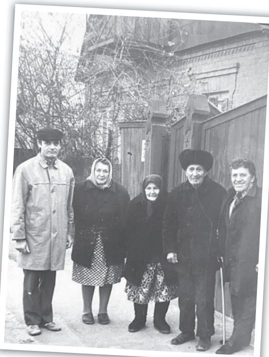
Спогади про найрідніших людей

Лікар випише рецепт із розрахунку, що максимальна добова доза становить п'ять тест-смужок, а максимальний період курсу лікування за рецептом 90 днів.