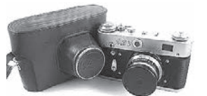
Фото з підписом, описом зображеного та роком зйомки, надсилайте на адресу gazetakremenchuk@gmail.com, або в Телеграм за номером +38098-124-84-90. Також фото можна надсилати до редакції за адресою: м. Кременчук, вул. Шевченка, 50А. Усі фото повертаємо власникам.

Ми пропонуємо вам поділитися спогадами з земляками та надіслати фото зі своїх сімейних архівів. Ми їх обов'язково опублікуємо.