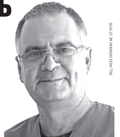
ЛІЦЬ МОЗ УКРАЇНИ АЕ 571070

динні порушення, стрибки кров'яного тиску, втомлюваність, а найчастіше – біль різної інтенсивності, який інколи не дає життя ні в день, ні в ночі. Захворювання хребта чи суглобів майже ніколи не бувають ізольованими. Це, зазвичай, комплексні порушення в різних системах організму людини. Є первинні порушення, є вторинні, які виникають, як відповідь на процес, який має головне значення у кожному окремому випадку, у кожного окремого пацієнта. Про ці хвороби хребта чи суглобів написано багато книжок видатними вченими-лікарями. Всі ці стани не перелічити зараз. Як лікар з 28-річним досвідом, я можу зараз тільки порадити вам. По-перше: є прояви ці стани, які вас турбують – не гайте часу. Зверніться за допомогою до лікаря. По-друге: не жалійте часу та своїх витрат на здоров'я. Чим більше запущеність хвороби, вище стадія ушкодження, тим більше треба в подальшому зусиль, щоб подолати вашу недугу. Не доводьте до стадії, коли повинен працювати тільки хірург. Можна замінити суглоб на штучний, можна прооперувати хребет, але... Погодьтеся, що своє краще. На перших стадіях артрозу без-