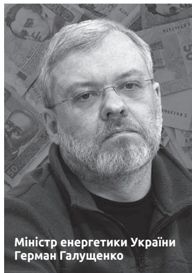
Міністр енергетики України Герман Галущенко

Ситуацію, коли деякі заможні громадяни не платять за спожиту електроенергію і зловживають заборонаю на від'єднання споживачів від світла, прокоментував у Facebook народний депутат від «Батьківщини», перший заступник голови комітету Верховної Ради з енергетики Олексій Кучеренко.