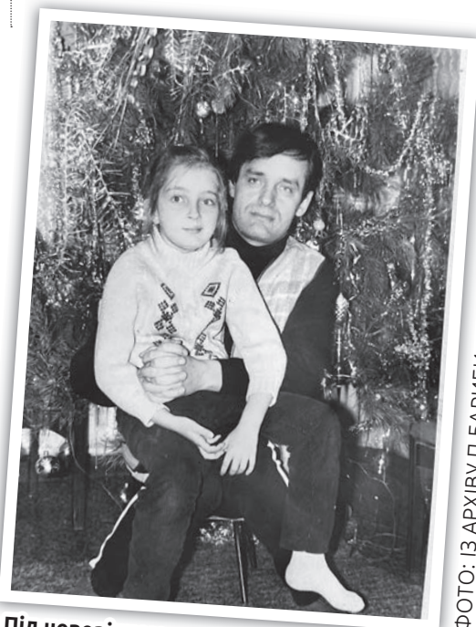
Під новорічною ялинкою

Проте, у разі якщо батько позбавлений батьківських прав, він не має права на таку відпустку.