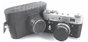
Фото з підписом, описом зображеного та роком зйомки, надсилайте на адресу gazetakremenchuk@gmail.com , або в Телеграм за номером +38098-124-84-90 . Також фото можна надсилати до редакції за адресою: м. Кременчук, вул. Шевченка, 50А . Усі фото повертаємо власникам.

Ми пропонуємо вам поділитися спогадами з земляками та надіслати фото зі своїх сімейних архівів. Ми їх обов'язково опублікуємо.